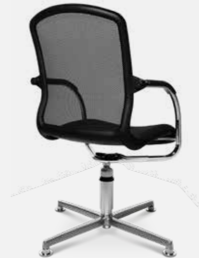
AluMedic 50 3D-Visit