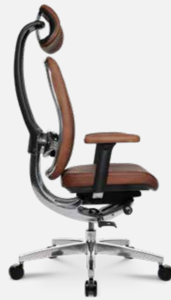
AluMedic Limited S