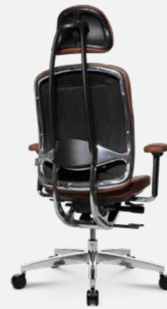
AluMedic Limited S Comfort