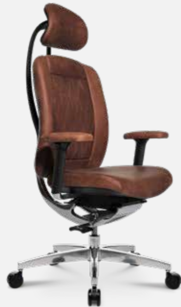
AluMedic Limited S