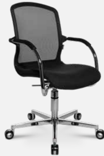
AluMedic 50 3D-Visit