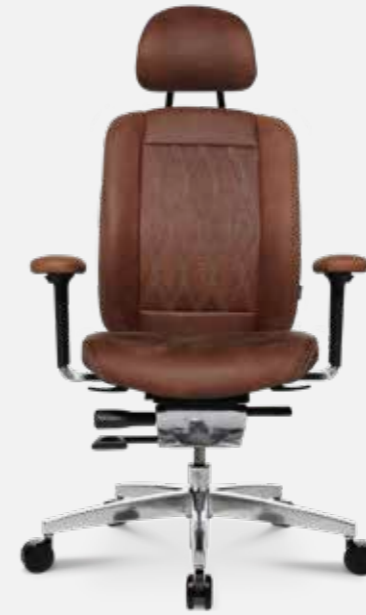
AluMedic Limited S Comfort

AluMedic Ltd. Bei dem AluMedic Limited in High Performance Ausstattung werden ausschließlich hochwertigste Materialien verwendet: Handpoliertes Aluminium, feinstes Leder auf Sitz und Kopfstütze sowie Armlehnen.