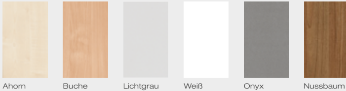
Ahorn Buche Lichtgrau Weiß Onyx Nussbaum