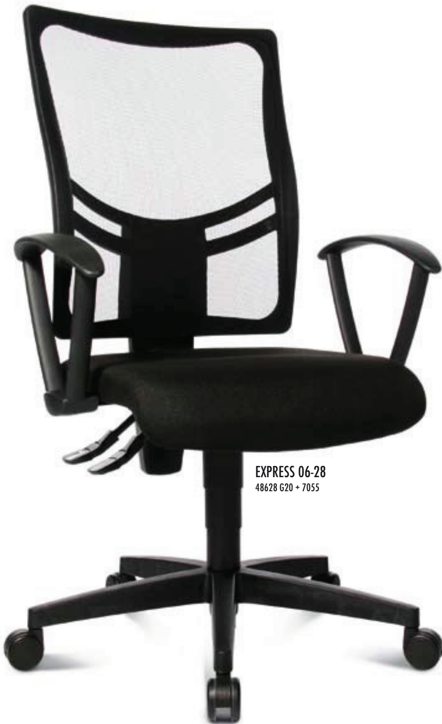
EXPRESS 06-28 48628 G20 + 7055