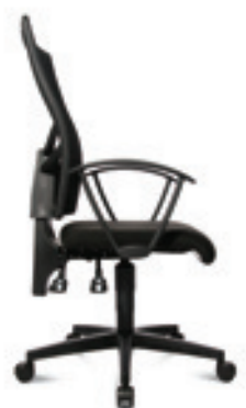
EXPRESS 06-28 48628 G20 + 7055