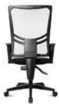
EXPRESS 06-28 48628 G20 + 7055