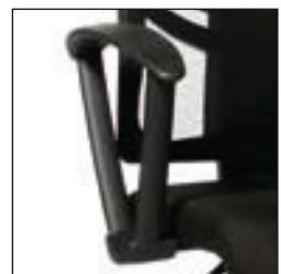
R (0) ART.-NR. 7055