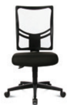
EXPRESS 06-28 48628 G20