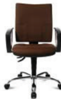
EXPRESS 06-27 48627 G08