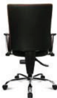
EXPRESS 06-27 48627 G08