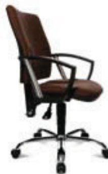
EXPRESS 06-27 48627 G08