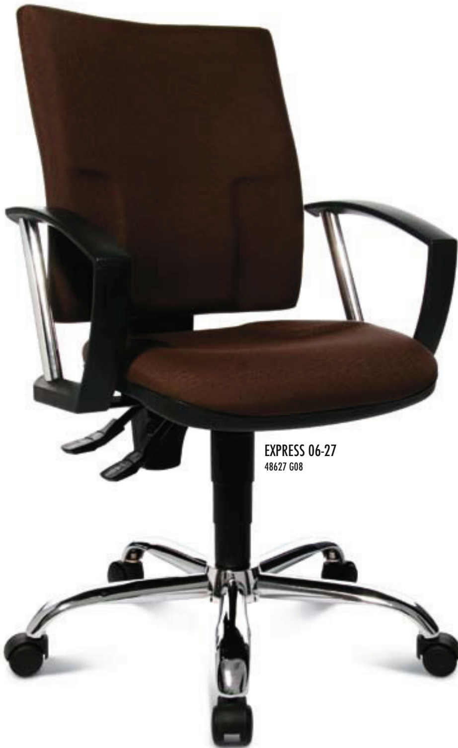
EXPRESS 06-27 48627 G08