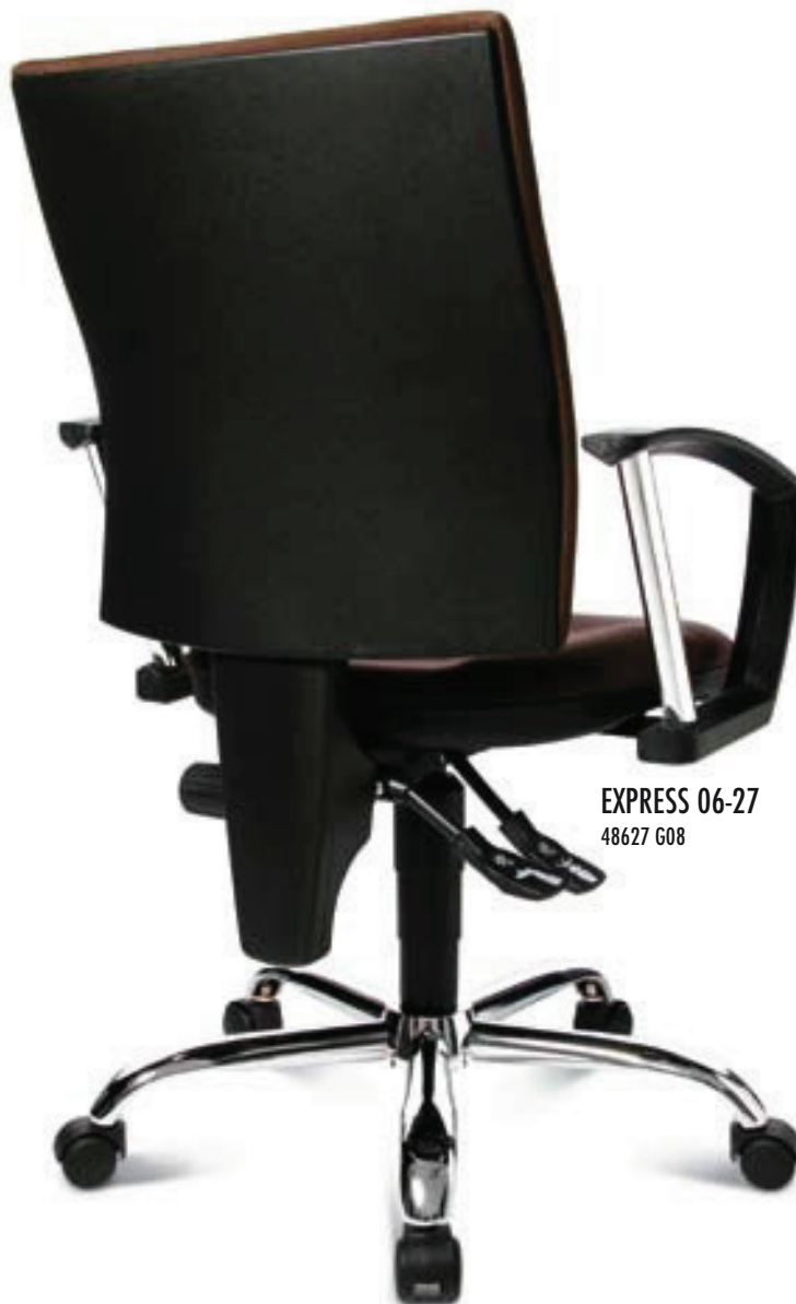
EXPRESS 06-27 48627 G08